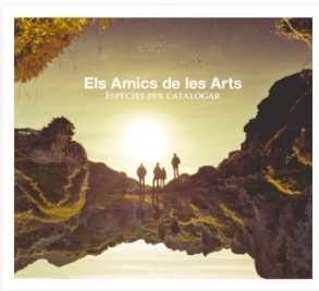
Espècies per catalogar Discmedi, 2012