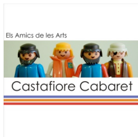
Castafiore Cabaret Pistatxo Records, 2008 Distribuido con el nº 153 de la revista Enderrock