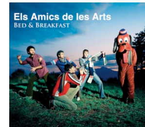
Bed & Breakfast Discmedi, 2009