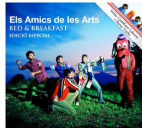
Bed & Breakfast. Edición especial Discmedi, 2010