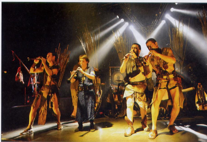
Els Berros De La Cort

Els Berros De La Cort do dress up like extras from Game Of Thrones – lots of leather, studs, feathers and bare torsos – but they do it well, and given that they're at root a bunch of street performers, that's a fair